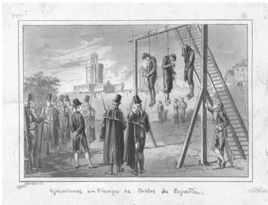
Vicente Urrabieta: Execucions en temps de Carlos de España , dibuix a la mina de plom i aiguada. Barcelona, Unitat Gràfica de la Biblioteca de Catalunya. (L'estampa aparegué a Balaguer 1863, V, 574-575).

També d'Urrabieta, però gravats per Furnó, són Jaume el Conqueridor lliurant l'espasa al seu fill 35 , l'episodi del guant de Corradino 36 i l'emperatriu Isabel Cristina embarcant-se a Barcelona cap Alemanya 37 . Altres il·lustracions de Vicente Urrabieta, sobre el bei de Tunis davant Carles V a Barcelona 38 , la que representa Pau Claris 39 , Rocaguinarda i els seus bandolers 40 , el jurament dels capitans barcelonins el 1713 41 , el general Bellver i Balaguer 42 , o