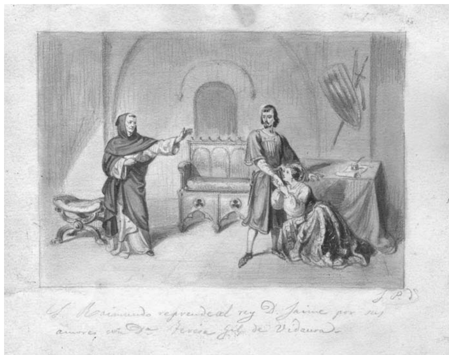
Josep Puiggarí: Sant Ramon de Penyafort reprenent Jaume I i Teresa Vidaure pels seus amors , dibuix a la mina de plom i aiguada. Barcelona, Unitat Gràfica de la Biblioteca de Catalunya. (L'estampa aparegué a Balaguer 1861, II, 398).

Generalitat ha passat a incorporar-se al Museu d'Història de Catalunya. El dibuix en el que es basà Roca per gravar aquesta composició és dels que ingressaren a la Biblioteca de Catalunya amb el llegat Furnó 17 .